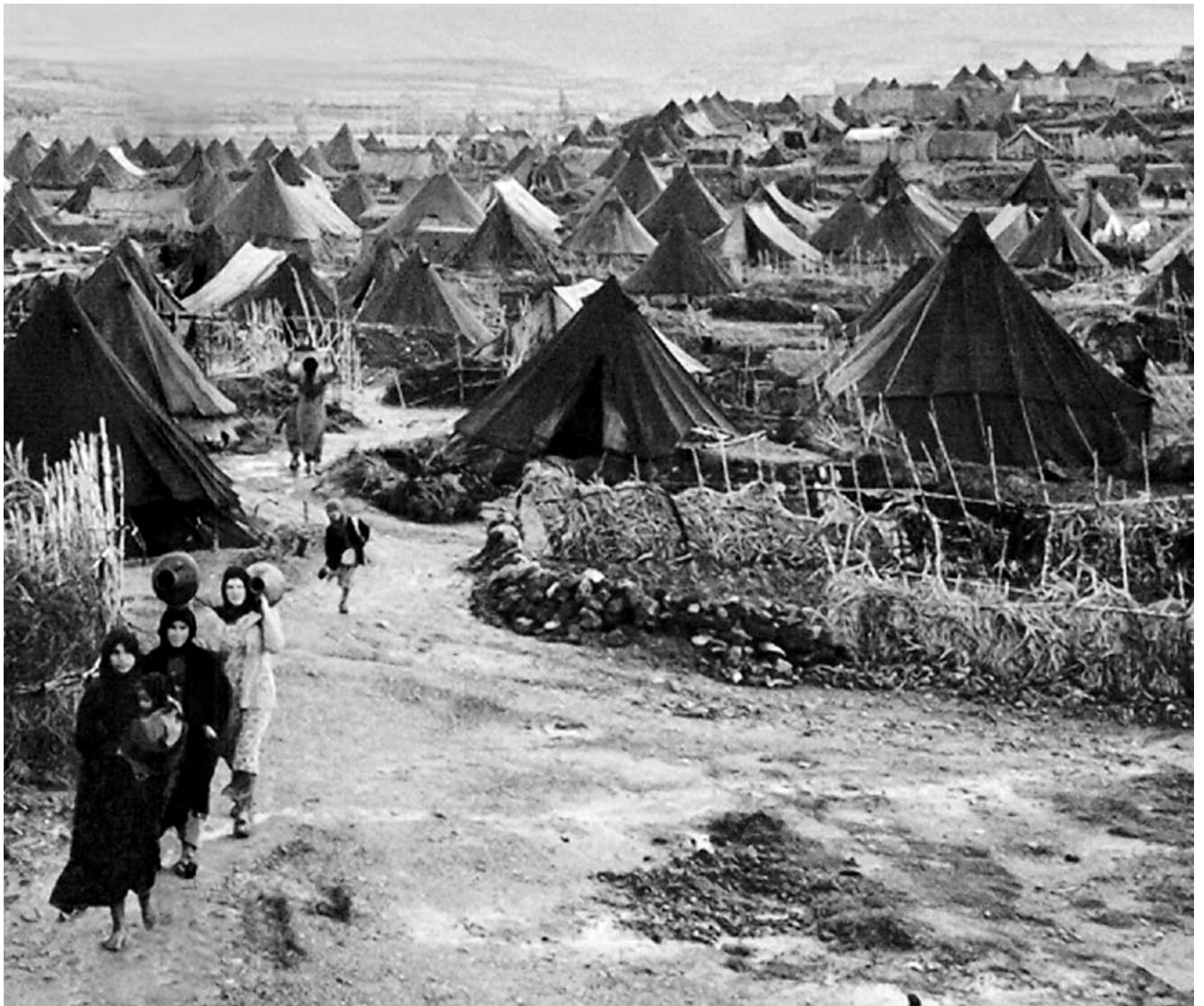
zuivering van toepassing is", zegt de Israëliische historicus Ilan Pappé.