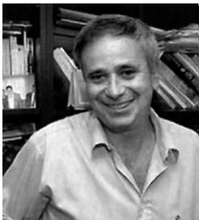
Ilan Pappé: „De toekomst van mijn land staat op het spel.”

Eens was Ilan Pappé een gewone Israëliische jongen, die dacht dat de Palestijnen in 1948 vrijwillig hun land hadden verlaten. Nu spreekt hij, als historicus, van een etnische zuivering, die nooit is gestopt. „Veiligheid boven alles stellen kan niet. Ik wil geen Zuid-Afrikaanse Boer worden.”