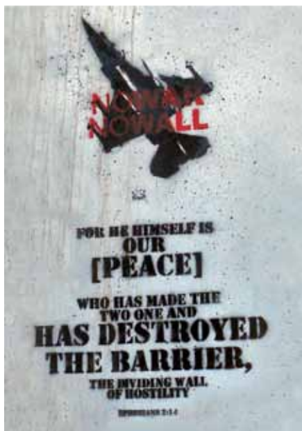
Ef. 2:14 op de Israëliische afscheidings- muur in Bethlehem

het besef dat “de muur is afgebroken” (Ef 2:14), is door het evangelie van Jezus Christus al wereldwijd sterk verankerd in de harten van mensen. Dat besef heeft zelfs uitdrukking gekregen in een mondiaal kader van mensenrechten en internationaal recht. Het komt tot uiting in een beeld naast het hoofgebouw van de VN bij deze profetische tekst: “En Hij zal richten tussen volk en volk en rechtspreken over machtige natiën. Dan zullen zij hun zwaarden tot ploegscharen omsmeden en hun speren tot snoeimessen; geen volk zal tegen een ander volk het zwaard opheffen, en zij zullen de oorlog niet meer leren.” (Jes. 2:4, NBG) “