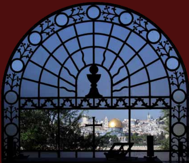
Afb.: Uitzicht over Jeruzalem vanuit de kerk Dominus Flevit ('de Heer huilde'; vgl. Luc. 19:41) op de Olijfberg

Als je oog hebt voor het lot van de Palestijnen, kom dan aan onze kant staan en help ons. We hebben mensen nodig die in de praktijk werken aan recht en gerechtigheid. Als dit echter betekent dat je eenzijdig wordt en tégen mijn Joodse broeders en zusters, ga dan alsjeblieft weg. Zulke vriendschap hebben we niet nodig. We hebben een gemeenschappelijke vriend nodig, en niet nóg een vijand.